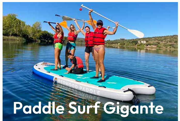
Paddle Surf Gigante