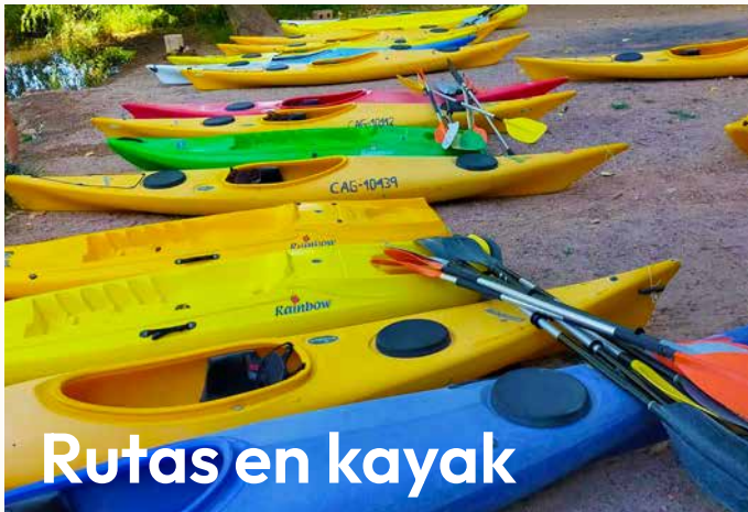
Rutas en kayak